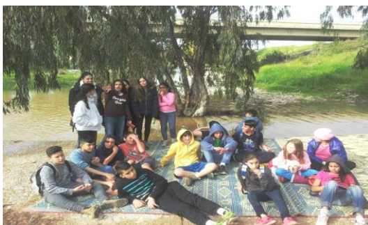
Gemeinsam etwas erleben