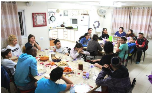
Zusammensitzen und miteinander reden