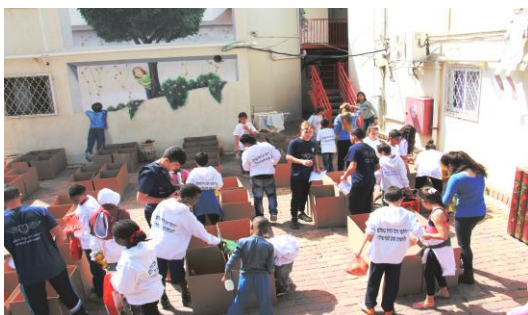
Mit vereinten Kräften für Bedürftige wirken