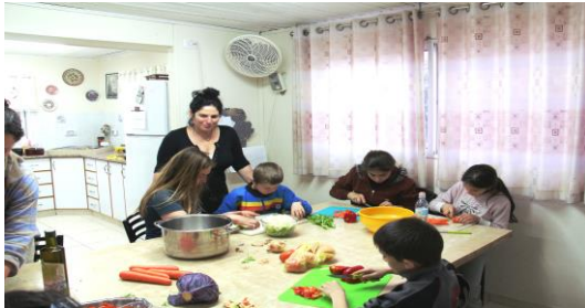
Gemeinschaftliche Mahlzeiten vorbereiten

Integraler Bestandteil NEVE HANNAs sind ebenfalls die Freiwilligen aus Deutschland, die bei der Bewältigung vieler alltäglicher Aufgaben helfen, enge Beziehungen zu ihren Familiengruppen und zu den Kindern aufbauen und zugleich während ihres sozialen Jahres in Israel besondere Erlebnisse miteinander teilen, wie Seminartage, das Entdecken von Land und Leuten und z. B. im letzten Jahr einen Empfang anlässlich